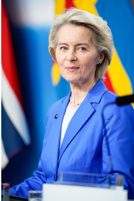
Ursula von der Leyen, Presidente della Commissione europea

oggi articolato in 52 programmi. Un elemento centrale della riforma è il nuovo Competitiveness Fund , strettamente collegato a Horizon Europe , che intende trasformare ricerca e innovazione in capacità industriale e tecnologie strategiche, attraverso un accesso semplificato ed un'unica regolamentazione ( single rulebook ). Sul piano della governance , la Commissione propone un nuovo meccanismo annuale di indirizzo che consentirà a Parlamento e Consiglio di identificare insieme le priorità politiche e le relative allocazioni per l'anno successivo, superando la logica dei negoziati settennali. In caso di gravi crisi, il Parlamento sarà coinvolto immediatamente tramite un crisis mechanism , rafforzando il ruolo democratico dell'istituzione nelle scelte di spesa. La proposta della Commissione passerà ora all'esame degli Stati membri in Consiglio, che dovranno raggiungere l'unanimità, mentre il Parlamento europeo sarà chiamato ad esprimere il proprio consenso.