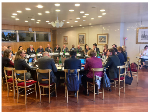
I lavori del Dialogo italo-tedesco

Il futuro della prossima legislatura europea e la necessità di garantire l'autonomia strategica europea; le prospettive economiche, finanziarie e politiche in Italia e Germania; come rafforzare l'Unione dei mercati dei capitali (UMC); sviluppi attuali e futuri della finanza sostenibile in entrambi i paesi e in Europa; il ruolo dei settori bancario e assicurativo come investitori istituzionali; lo stato dell'arte della riforma della strategia europea degli investimenti al dettaglio (nell'ambito della revisione della Mifid II e della Direttiva sulla Distribuzione Assicurativa); le sfide e le prospettive della digitalizzazione e dell'innovazione nel settore finanziario, compreso un euro digitale.